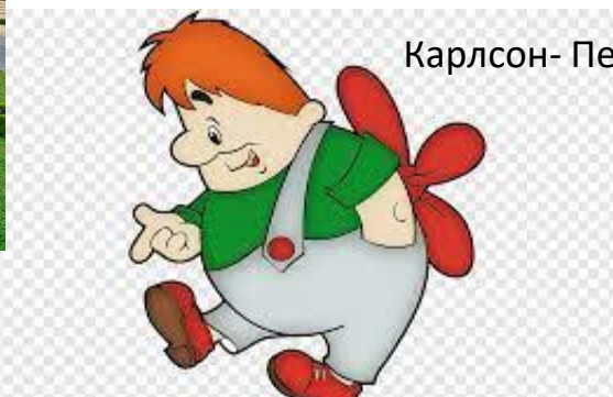
Карлсон- Первое словр